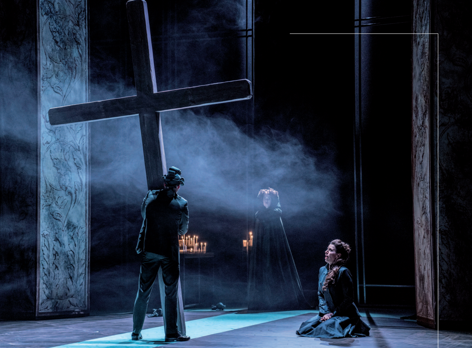
Vivaldi-Dangerous Liaisons i.s.m. Opera2Day, 2019