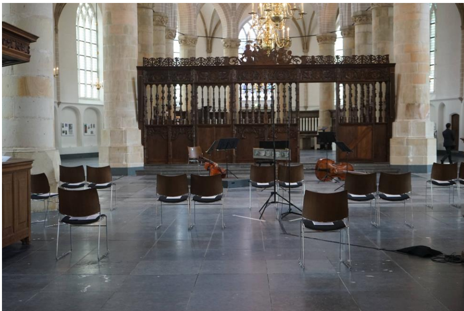
'We mogen weer!' Vijf keer spelen voor telkens dertig bezoekers, Grote Kerk Naarden, 1 juni 2020

Tegelijkertijd is in 2020 door de uitbraak van een pandemie een onvoorzien risico opgetreden. De gevolgen daarvan zullen naar verwachting nog jarenlang invloed hebben op de bedrijfsvoering van de Bachvereniging.