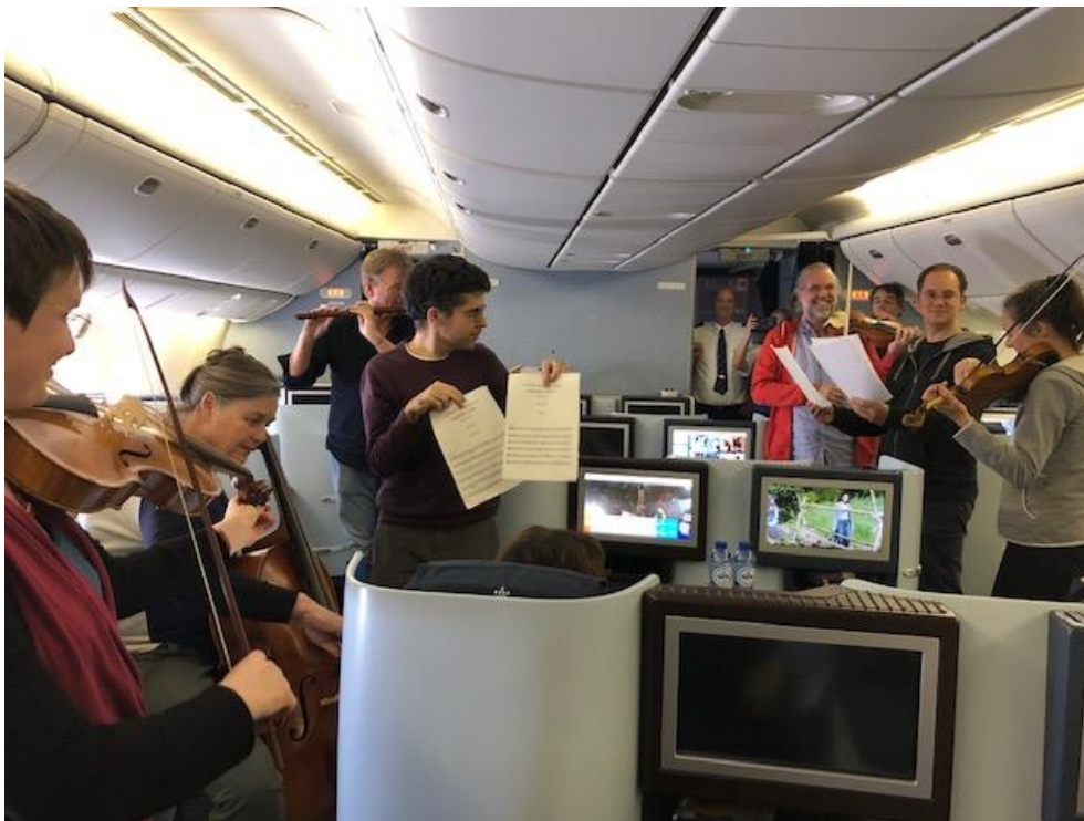
De 'Air' van Bach, gespeeld voor sponsor KLM, t.g.v. het honderdjarig bestaan van de luchtvaartmaatschappij – terugvlucht uit Japan, 7 oktober 2019

De Stichting heeft sinds 1 januari 2008 een ANBI-status en sinds 1 januari 2012 de status van culturele ANBI. Het bestuur van de Stichting toetst jaarlijks of zij aan alle eisen voor de ANBI-status voldoet.